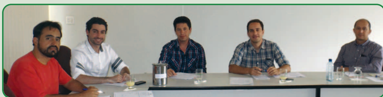
Encontro dos membros da Comissão, na sede do Conselho

Prof. Titular - FAMEV / UFU CRMV-MG 2401