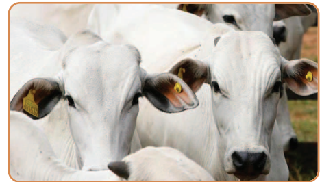
Medida visa incentivar mais pecuaristas a adotarem a certificação de seus rebanhos

política de sustentabilidade e maior aproximação dos pecuaristas cientes da importância da sanidade para ganho de produtividade e confiança do consumidor, adotou prontamente o pedido de inovação do produtor, visando incentivar mais pecuaristas a adotarem a certificação de seus rebanhos, uma vez que a segurança alimentar é uma das metas mais importantes para a saúde de todos os brasileiros.