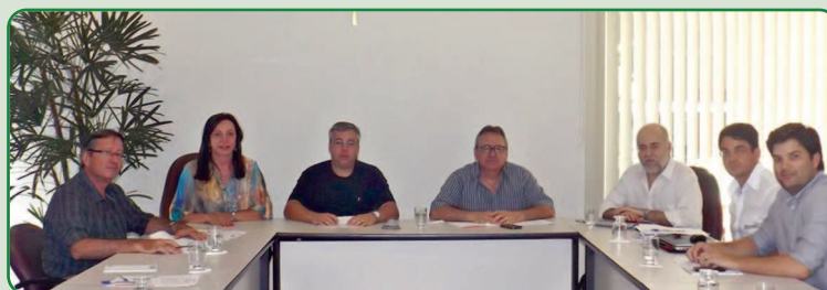
A Comissão é composta por nove profissionais

Professor do IFMG/Campus de Bambuí CRMV-MG 1432/Z