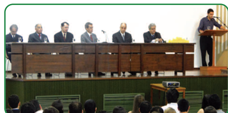
Formatura de Medicina Veterinária na UFMG