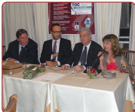
Mesa de honra

cialização em “Clínica e cirurgia de pequenos animais” e mestrado em “Clínica e cirurgia” na mesma instituição. É especialista em “Clínica e cirurgia de animais silvestres e exóticos” pela Quallitas; co-fundador da Associação Bichos Gerais e atual presidente da ONG que promove assistência médica veterinária a cães e gatos de população de baixa renda. Membro de comitês de ética para experimentação animal da UFMG e PUC-MG. Sócio proprietário do Animal Center, que acolhe atualmente mais de 300 animais entre cães, gatos e silvestres vítimas do tráfico e perda de hábitat encaminhados pelo IBAMA e polícia militar ambiental e participante junto ao Ministério Público da comissão interinstitucional para monitoramento da colônia de gatos do Parque Municipal de Belo Horizonte.