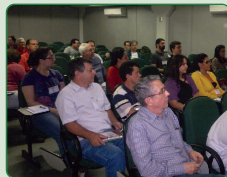
Aula do curso de perícia forense