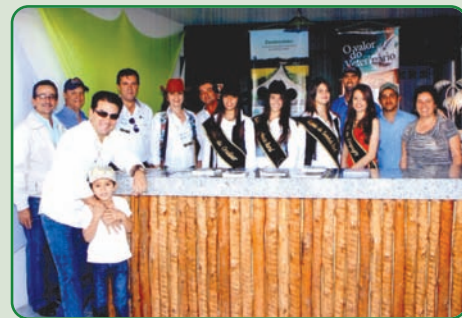
Stand do CRMV-MG na Expomontes