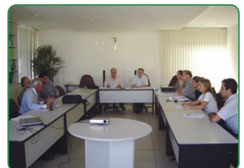
Reunião Coesui-MG na sede do conselho

ta. Quanto ao número de granjas por responsável técnico ficou definido o máximo de 60 estabelecimentos por profissional, podendo o RT distribuir as visitas em função do seu conhecimento a respeito das condições sanitárias das granjas por ele assistidas.