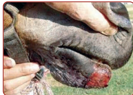
Lesão externa de lábio equino