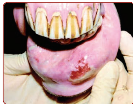
Lesão interna de lábio equino