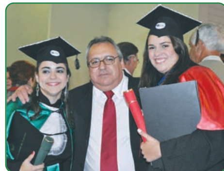
Alunas que se destacaram nos cursos de Veterinária e Zootecnia da UFLA

O CRMV-MG, em sua política de valorização da educação continuada e aproximação com os novos profissionais, presta homenagem a fim incentivar médicos veterinários e zootecnistas.