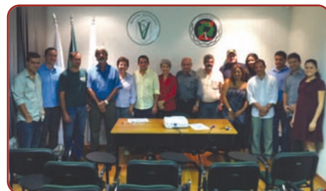
Posse da diretoria da AVZ.

O CRMV-MG os parabeniza e estima sucesso na gestão.