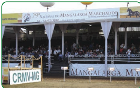
Participação do CRMV-MG.