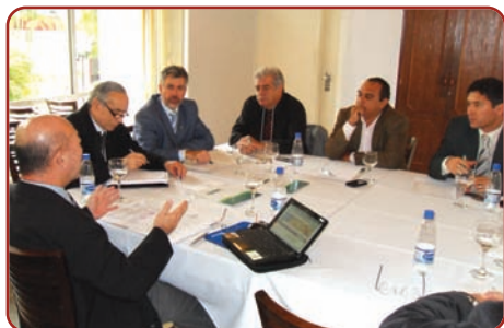
Reunião administrativa dos presidentes de CRMVs.

Os presidentes dos conselhos de Santa Catarina, Paraná e Rio Grande do Sul abriram o evento e enfatizaram a importância de encontros desse tipo, uma vez que os participantes podem trocar experiências. A partir daí, grupos divididos por setor de atuação puderam discutir e apresentar sugestões e as apresentaram ao final do evento.