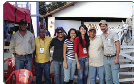
Equipe da Comissão de Inspeção da ABCCMM.