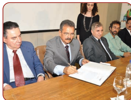
Posse do novo presidente da Emater-MG