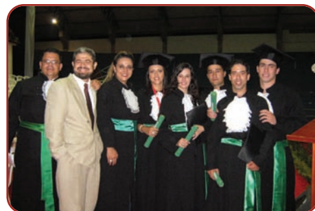
Primeira turma de formandos em Medicina Veterinária da UNIPAC-Lafaiete