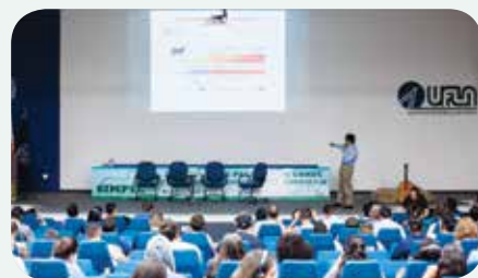
Simpósio contou com 25 palestras

o V Simpósio Internacional de Produção de Bovinos, que discutiu aspectos sobre ensino e pesquisa em ciência animal.