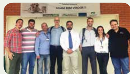
Na foto, organizadores e palestrantes do Simpósio

mental para que possamos agregar qualidade ao conteúdo programático e ao quadro de palestrantes”, avaliou a também conselheira do CRMV-MG.