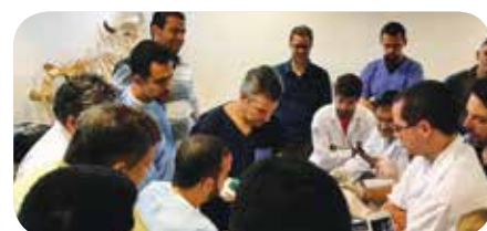
Curso de Ortopedia e Traumatologia contou com atividades práticas