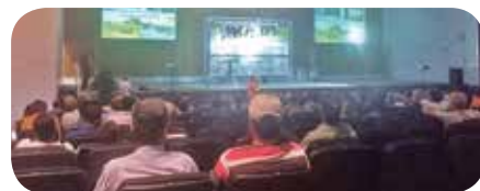
Profissionais do nordeste mineiro compartilharam experiências durante o evento

Precedente ao Simpósio, foi realizado o XXXVII Encontro dos Médicos Veterinários e Zootecnistas do Nordeste de Minas, no intuito de proporcionar a troca de experiências entre profissionais da pecuária leiteira que atuam na região.