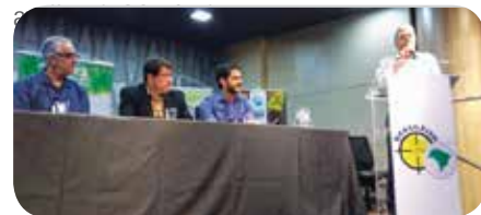
Evento reuniu mais de 200 participantes

“Este é considerado um dos maiores eventos sobre Leishmaniose do Brasil. O apoio do Conselho foi fundamental para sua realização. Trouxemos palestrantes internacionais que contribuíram bastante para as discussões. Foi um sucesso, com um ótimo público e já estamos planejando a próxima edição em 2018”,