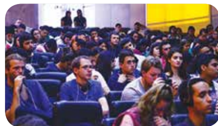
Evento reuniu mais de 500 participantes

foi promovido junto ao DZO/UFV, resultando em sua 1ª edição internacional. Desde então, o SIMLEITE ganhou força e tem se consolidado como um dos principais da pecuária leiteira brasileira.