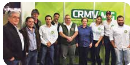
Representantes do CRMV-MG estiveram presentes no estande da entidade durante a Exposição