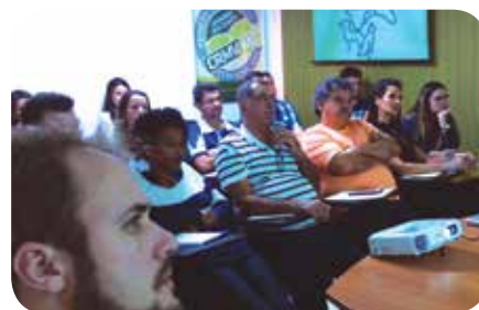
Evento foi realizado em Ipatinga