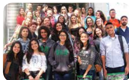
Eventos realizados com o apoio do CRMV-MG no primeiro semestre de 2017