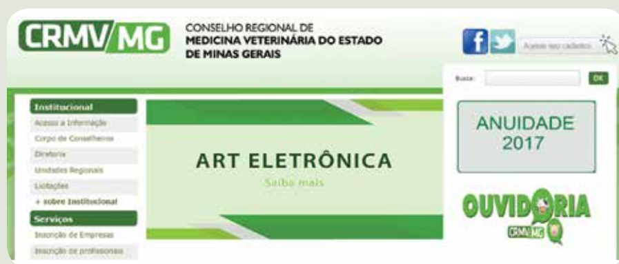
ART-e ganhou amplo destaque nas mídias do CRMV-MG

online, assim como o feedback positivo dos profissionais quanto ao novo procedimento. “Esta inovação fez com que o número de ARTs mais que dobrasse em relação à 2015, contabilizando mais de 4.100 documentos. Esse aumento substancial se deve ao fato da agilização da produção da ART e também pela obrigatoriedade da renovação anual do documento. Esperamos que 2017 o número de ARTs supere os 8.000 documentos.”, afirmou.