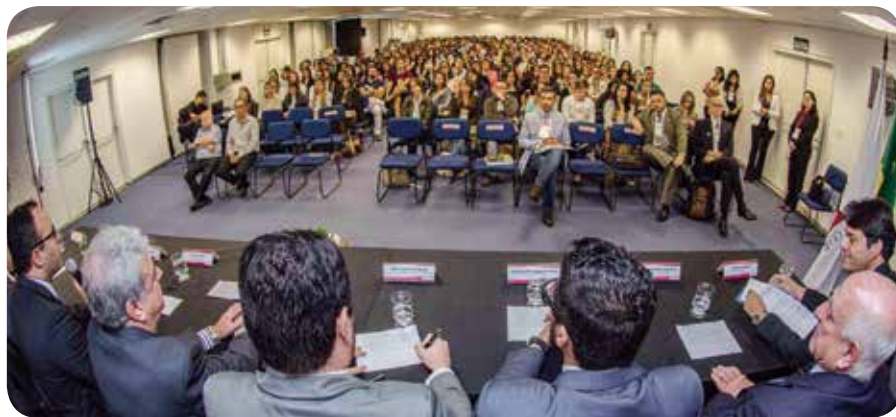
Mais de mil profissionais participaram do Congrevet

Em 2016, as cerimônias foram realizadas nos dias 03 de junho (Zootecnia) e 09 de setembro (Medicina Veterinária), em Belo Horizonte, homenageando 31 profissionais como destaques nas profissões. Também foram congratulados médicos veterinários que formaram-se em 1966, em virtude da comemoração dos 50 anos de graduação, bem como os oficiais que compõem o Corpo de Médicos Veterinários da Polícia Militar de Minas Gerais.