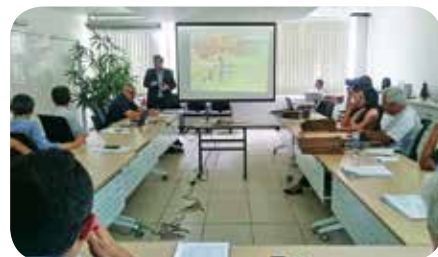
Plenária reuniu diretoria e conselheiros

e é importante passar isso ao CRMV-MG, antes de comercializarmos o produto, para mostrarmos que ele funciona e que fizemos os testes devidos", afirmou.