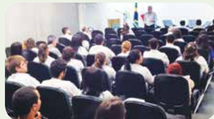
Funcionários expuseram dúvidas sobre normas

nheceu o empenho e o comprometimento de todos e destacou a importância do encontro.