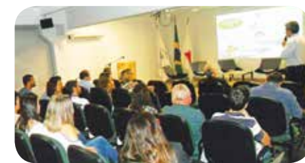
Solenidade de entrega na sede do CRMV-MG

Atualmente, são mais de 19 mil profissionais inscritos no Conselho. A expectativa é de que, em 2017, o número de médicos veterinários e zootecnistas inscritos no CRMV-MG ultrapassem os 20 mil.