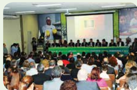
Evento reuniu profissionais de todas as regiões do Estado

gestão na propriedade que garanta rentabilidade", afirmou.