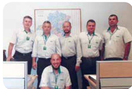
Fiscais do CRMV-MG

intuito que tem sido a estruturação de nossas ações. E dessa mesma forma faremos em 2017”, destacou.